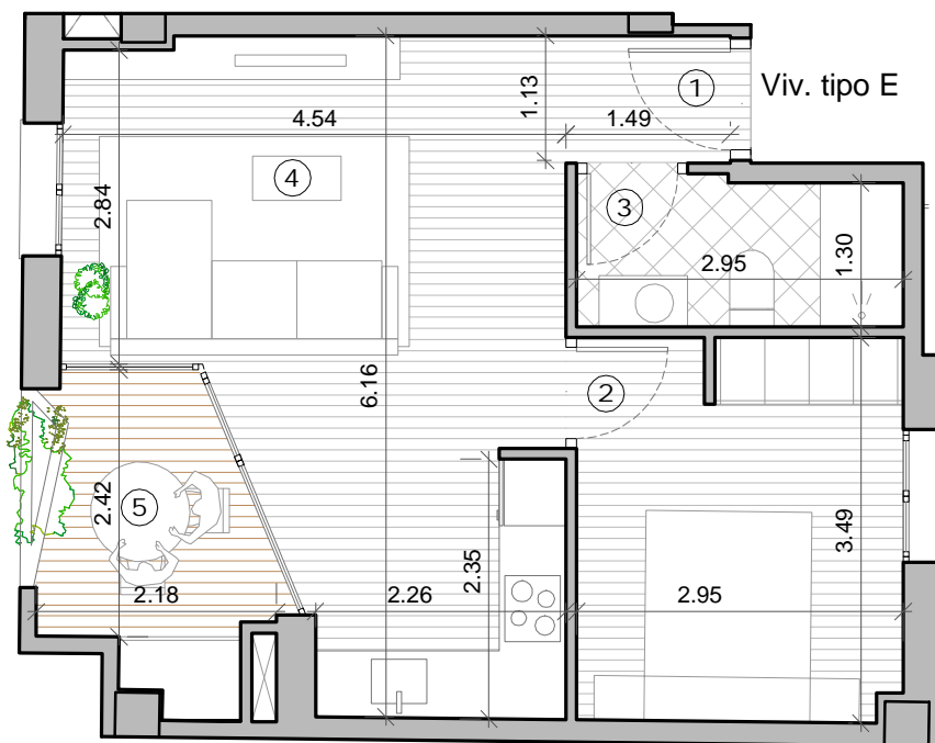
VIVIENDA TIPO E Escala 1:75